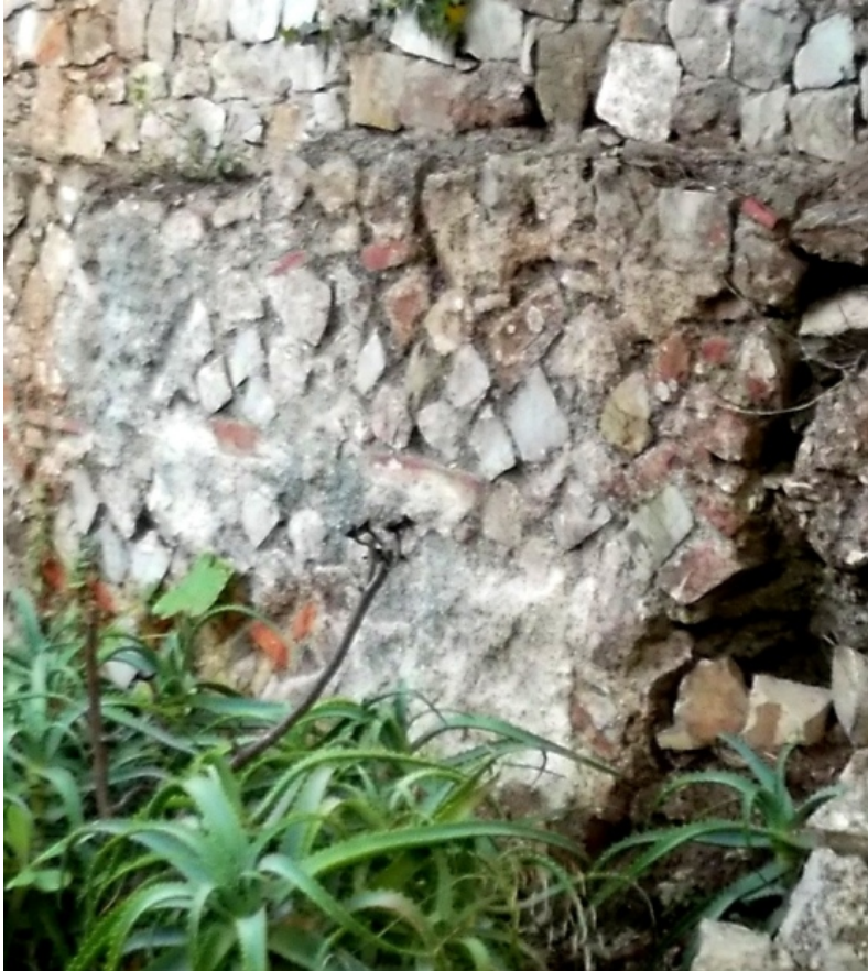
I resti della Villa romana di Cavo